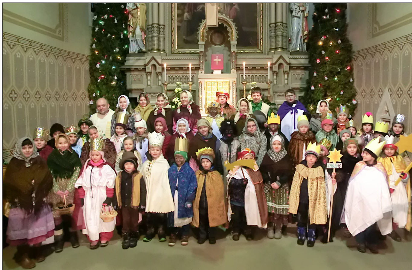
9. 1. 2016 – Tříkrálová sbírka.