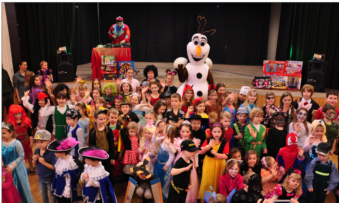
13. 3. 2016 – Dětský maškarní ples.