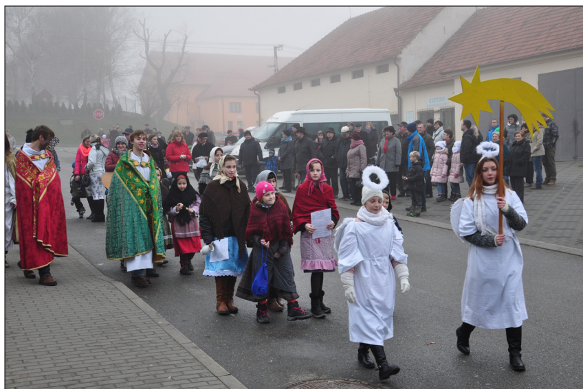
25. 12. 2015 – Živý betlém – průvod vyráží od radnice.