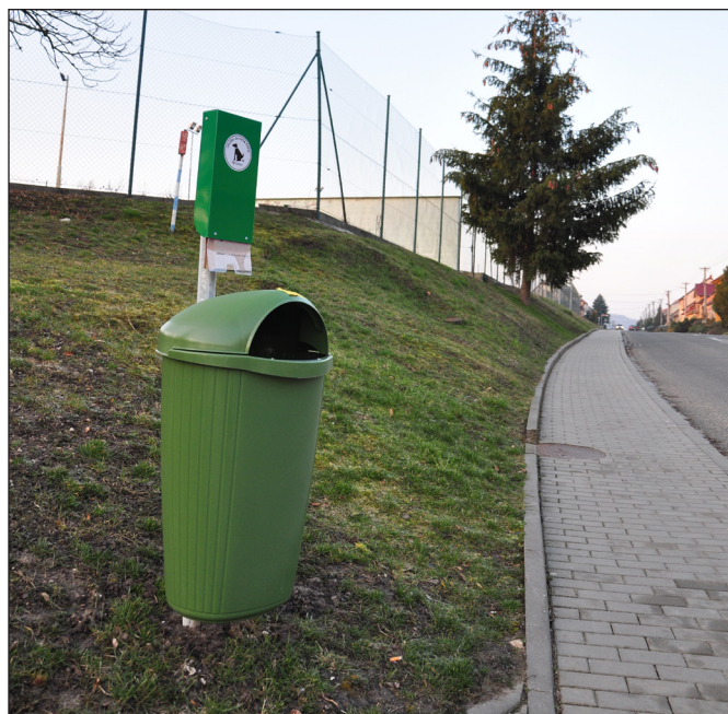
Nový odpadkový koš na Nikolčické ulici.

Vážení spoluobčané, před nedávnem byli v různých částech obce nainstalovány nové odpadkové koše včetně pytlíků na psí exkrementy. Doslechl jsem se, že někteří občané si myslí, že ty koše jsou jen na ty sáčky. Není tomu tak, tyto koše jsou určeny pro veškerý drobný odpad a postupně nahradí ty nevzhledné plechové. V obci je jich zatím nainstalováno 10 kusů, ale dalších 10 budeme ještě dodávat. Přeji si jen, aby vandalové tyto koše neničili a netrhali zbytečně pytlíky, které následně pohazují po parku. Bohužel se tak zatím děje. Vy, kteří často chodíte ven se svým pejskem, bych chtěl doporučit, abyste si pytlík utrhli a vždy ho měli u sebe, když jdete se