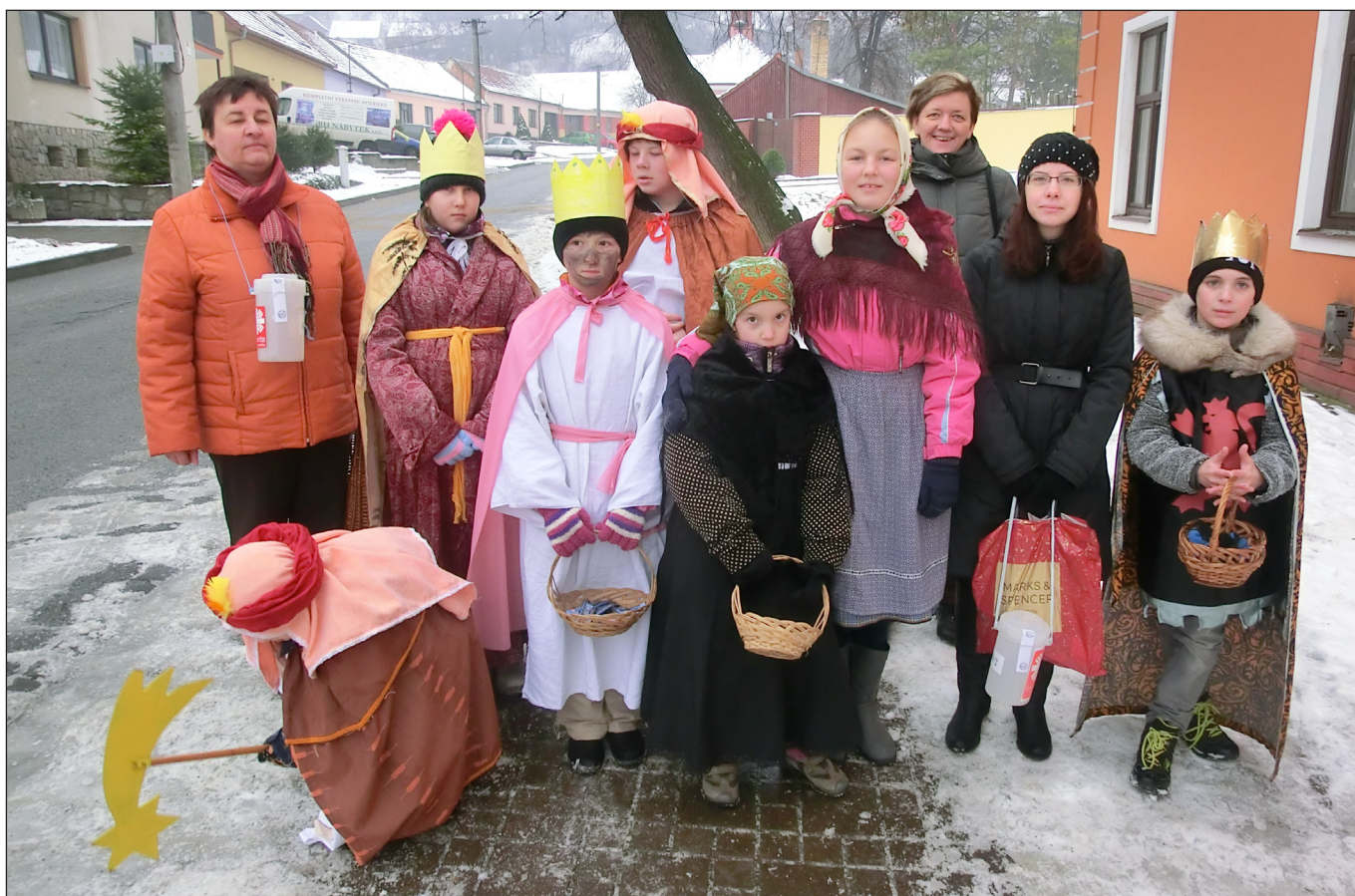
9. 1. 2016 – Rříkrálová sbírka.