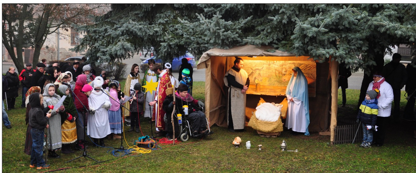
25. 12. 2015 – Živý betlém.