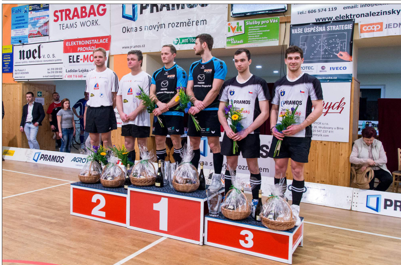
13. 2. 2016 – Stupně vítězů Grand prix 2016 v kolové.