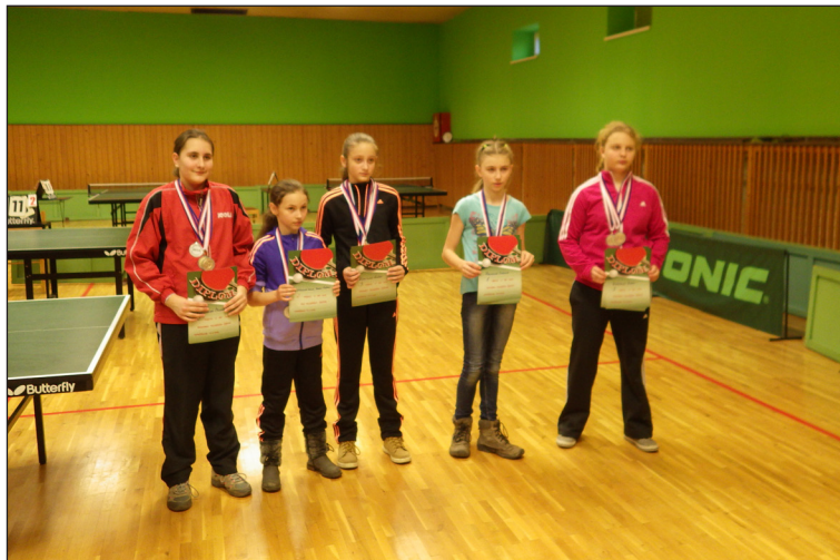
Nejlepší hráčky kategorie mladších zákyň na KP ve Strážnici.

Oddíl kolové má v žákovské kategorii dvě družstva. Šitbořice 1 (Šimon Urbánek, Dominik Šabata) Šitbořice 2 (Lukáš Franc, Ondřej Valíček). Oběma družstvům nelze upřít bojovnost, avšak vzhledem k obsazenosti turnaje vyspělejšími hráči skončili kluci na čtvrtém a pátém místě. Vzhledem k věku našich hráčů je to zdůvodnitelný výsledek a pro hráče samotné je to signál pro zvýšení tréninkového úsilí. Od roku 2012 obsazuje pořadatelský