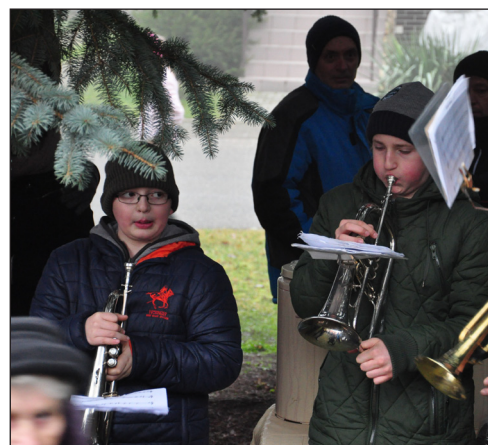
25. 12. 2015 – Živý betlém.