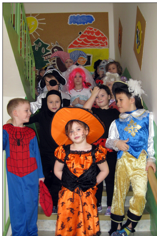
Masopust ve školce.

Na začátku roku se děti seznamovaly u tématu Jsme kamarádi. Poznávaly nové spolužáky, paní učitelky, třídu, tvořily pravidla společného soužití a učily se dbát o svoji bezpečnost ve školce i venku. Další téma, které navodila situace v obci, bylo Václavské hody. Seznámili jsme se s postavou svatého Václava, s krojem, tradicemi a všim co se hodů na dědině týká. Děti si také při dechové hudbě mohly vyzkoušet roli stárků a jako jejich maminky a babičky napéct zákusky z modelíny. V době dýňo-