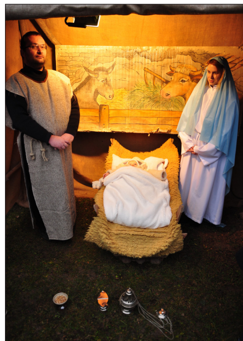
25. 12. 2015 – Živý betlém.