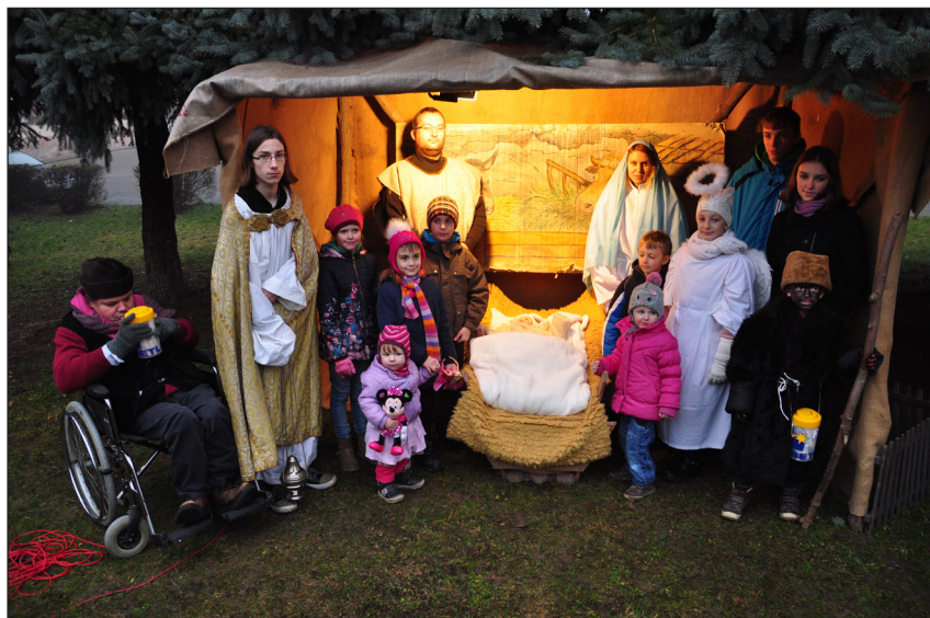
25. 12. 2015 – Živý betlém – „Ježíšci“ z minulých let.