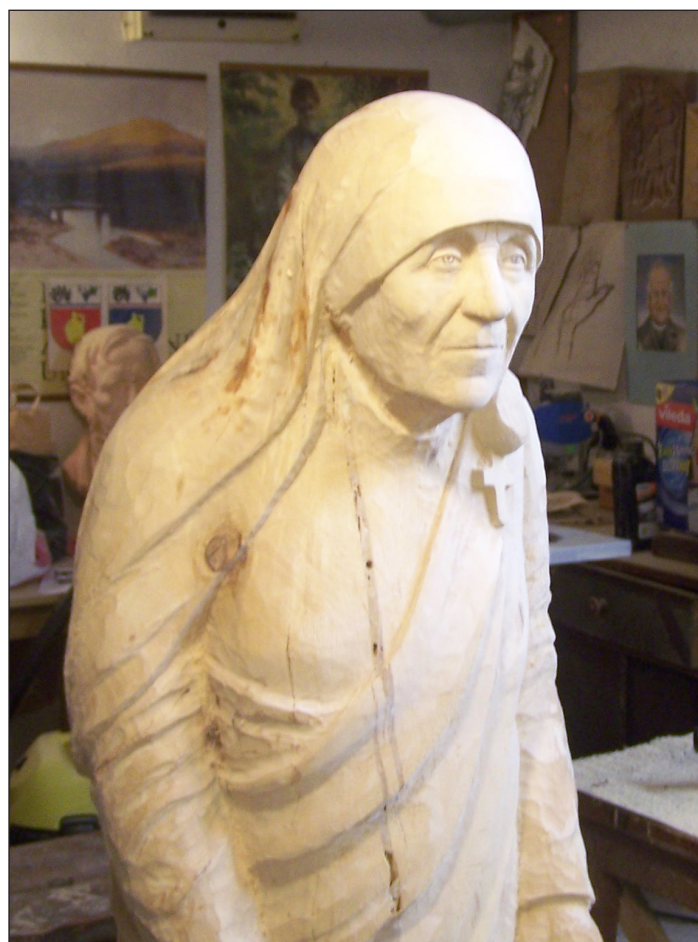
12. 3. 2016 – Socha matky Terezy pro farnost Žarošice.