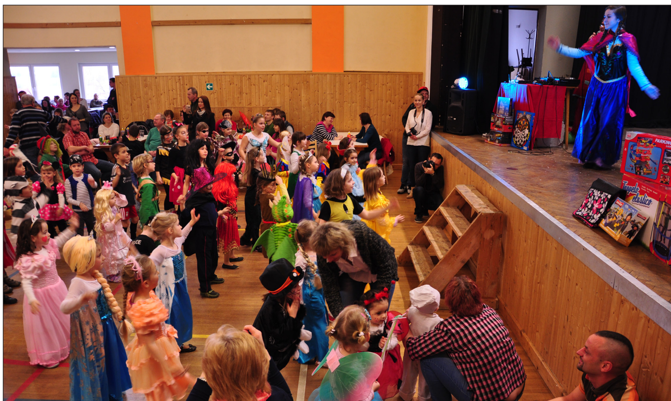
13. 3. 2016 – Dětský maškarní ples.