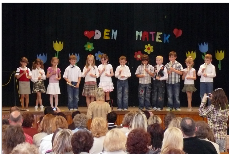
Den matek v Sokolovně.