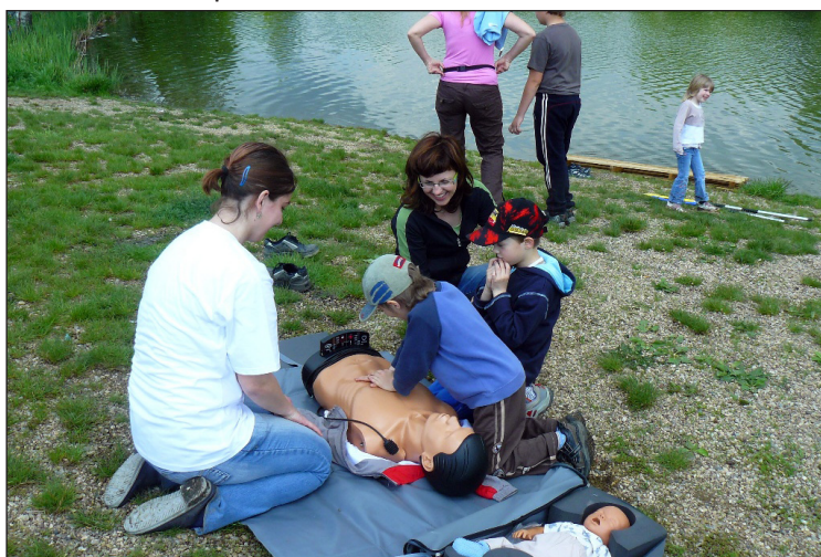
Nácvik první pomoci při rybářských závodech.

Děkujeme všem sponzorům, bez nichž by akce nemohla nabrat takových rozměrů: Pramosu, obci Šitbořice a časopisu Turista.