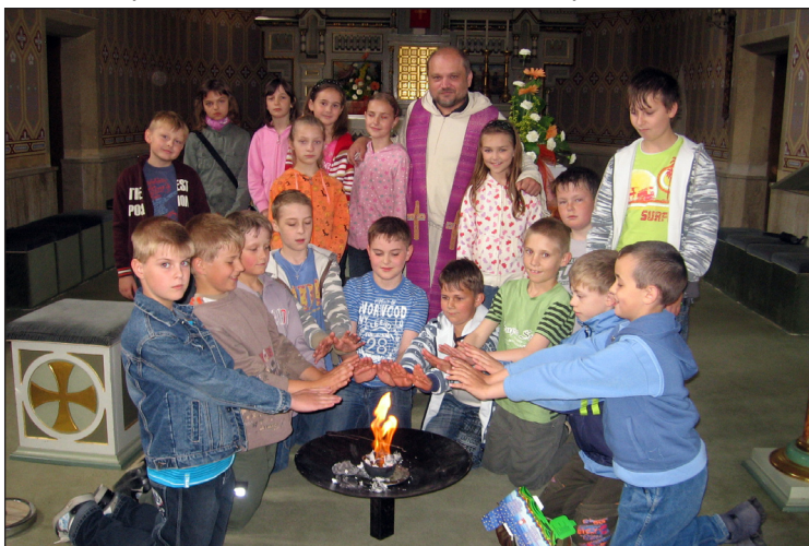
První zpověď třetáků – symbolické pálení hříchů.