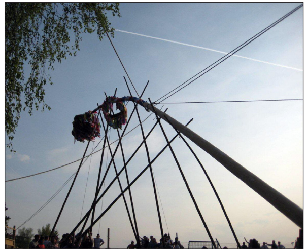
30. 4. 2010 - Stavěná máje.