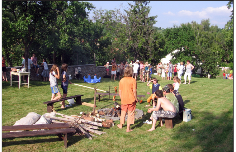
12. 6. 2010 - Farní den (na farní zahradě).