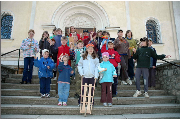
3. 4. 2010 - Velikonoční sobota - Klapači.