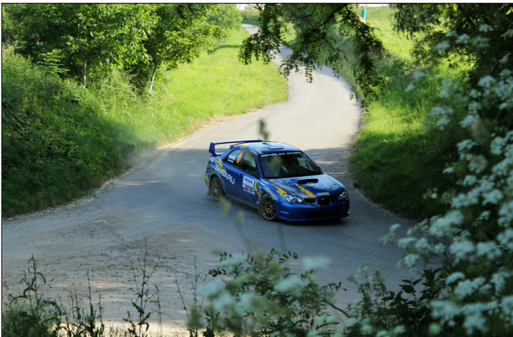
11. 6. 2010 - Agrotec Mogul rally (zatáčka u Nových hor).