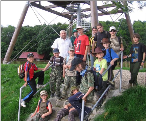
29. 5. 2010 - Výlet ministrantů na Nedánov.