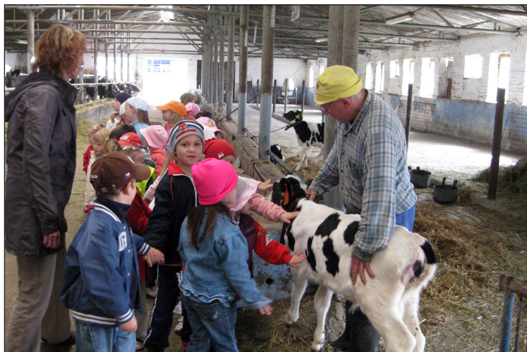
Prohlídka v Zemědělském družstvu.

Šitbořický SDH nám uspořádal ukázkovou akci v mateřské škole spolu s vyhlášením výtvarné soutěže Požární ochrana očima dětí. Hasiči velmi vhodnou formou seznámili děti s povinnostmi a důležitostmi hasičů. Umožnili dětem si všechno důkladně prohlédnout, osahat a vyzkoušet. Také nám dohodli besedu s Policíí ČR. Byla jsem