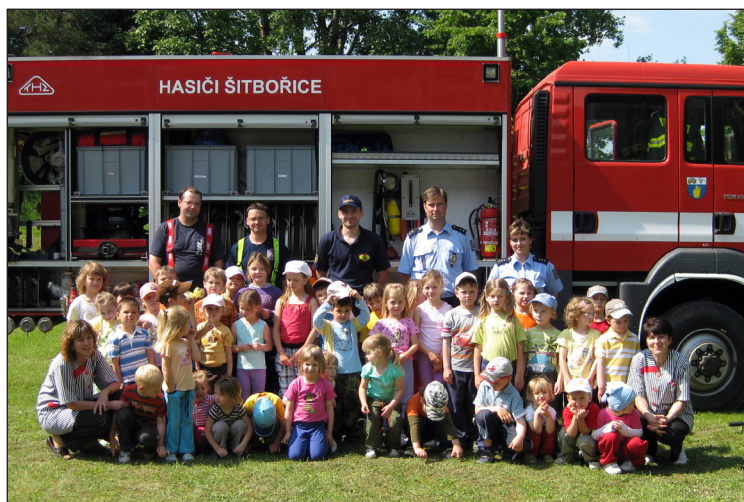
Hasiči a policie v Mateřské škole.