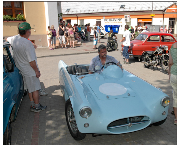
12. 6. 2010 - Sraz veteránů (u Orlovny).