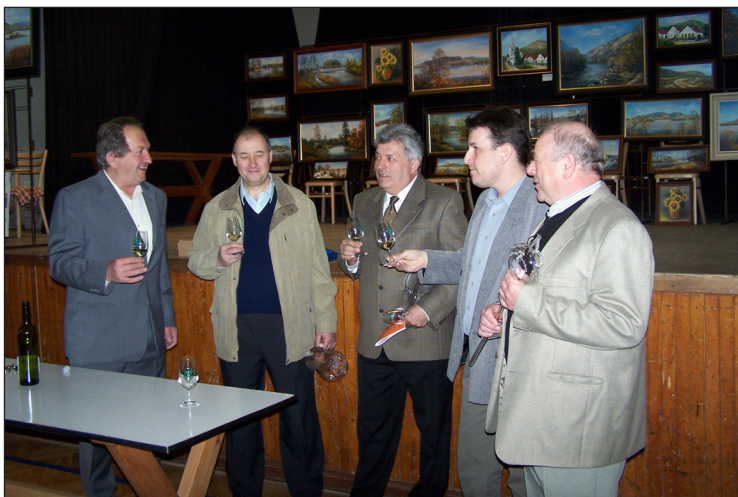
Předávání cen nejlepším vinařům.

Počet oprávněných voličů: 1 556 Přítomno voličů: 1 084 (69,66 % oprávněných) Odevzdáno platných hlasů: 1 082