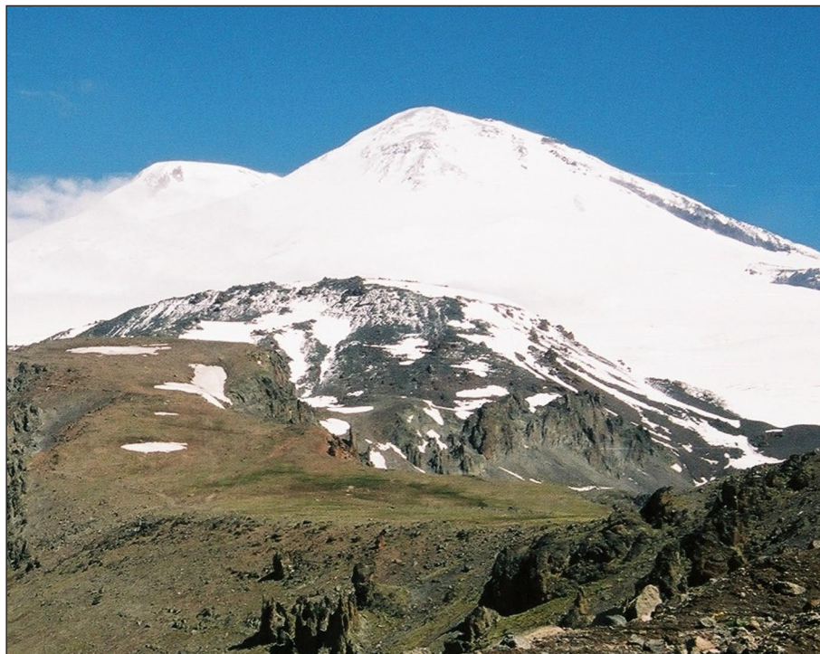
Elbrus - vlevo západní vrchol, vpravo východní

Na lanovce je hrozný nával. Čekáme asi hodinu než na nás přijde řada. Na rozdíl od ostatních už jsme tu byli především a cestou nahoru si připadáme jako staří mazáci. Nahore na Priutu je taky hodně lidí. V závětrí